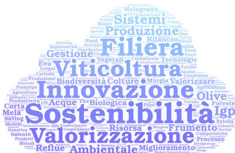
Figura 4 - Principali temi presenti nei progetti dei GO pugliesi