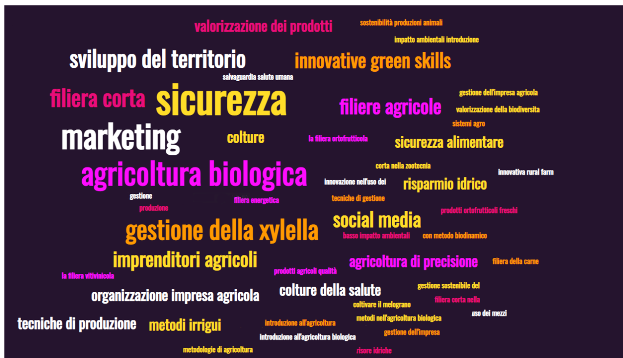
Figura 2 - Principali temi oggetto dei corsi di formazione